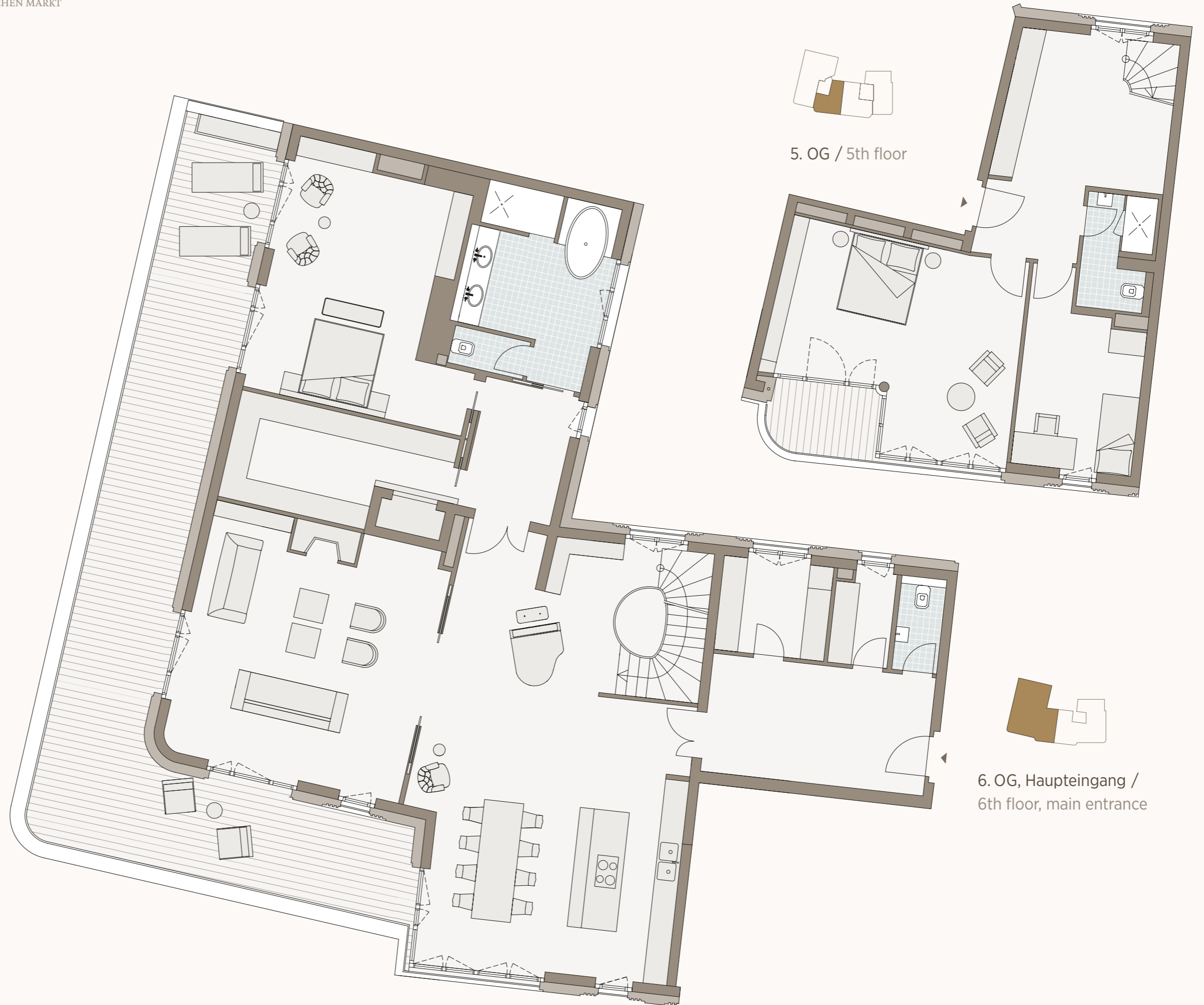
5. OG / 5th floor