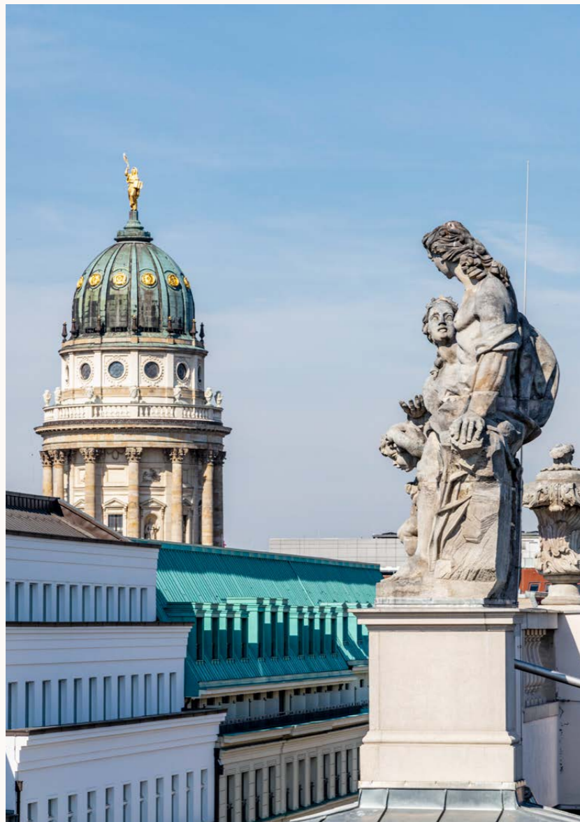
Blick auf den Französischen Dom / View of the French Cathedral

PENTHOUSE & ROOFTOP TERRACE / APARTMENT WITH 5 ROOMS / 347,78 SQM